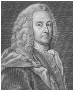
L. Holberg

Dette design er del af en lille kollektion inspireret af Ludvig Holberg's værker. Den dansk-norske digter levede fra 1684-1754, men selvom det er mange år siden, havde Holberg en særlig evne til at vise – og udstille – forskellige typer af mennesker, som er lige så aktuelle i vore dage som dengang.