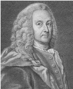
C.F. Clemens: L. Holberg

Dieses Design ist Teil einer kleinen, von den Komödien Ludvig Holbergs inspirierten Kollektion. Der dänisch-norwegische Dichter lebte 1684-1754, aber obwohl das lange her ist, hatte Holberg ein besonderes Talent dafür, verschiedene Menschentypen zu schildern – und auszuliefern – die heute ebenso aktuell sind wie damals.