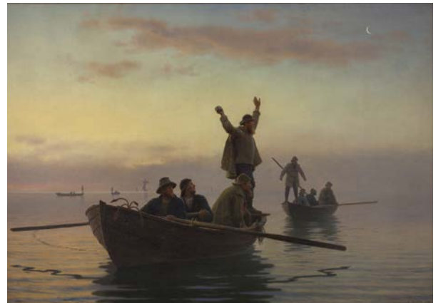
A. Dorph, Hornfiskefangst med drivvod. Tidlig morgen, 1880 Statens Museum for Kunst Public domain